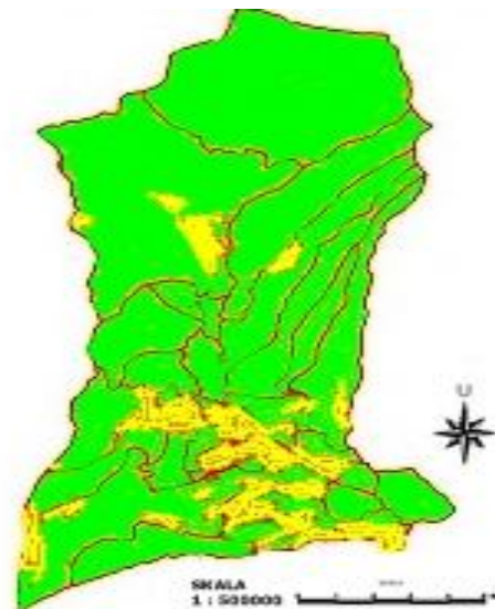
Gambar 3. Peta kesesuaian lahan tanaman apel di Kota Batu (■ = S1, ■ = S2)

Ketinggian Kota Batu berkisar antara 700 – 1500 meter dari permukaan laut (Wardani, 2005) sehingga sebagian besar wilayah Kota Batu masuk kedalam kelas kesesuaian lahan S1 dan sebagian kecil masuk ke dalam kelas S2.